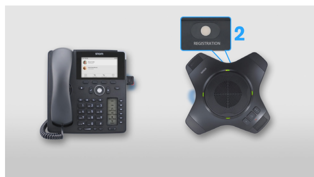
Etablir une connexion DECT entre le téléphone et l'extension conférence