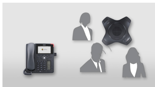
Maintenant vous pouvez utiliser l'extension conférence jusqu'à 25 mètre de distance